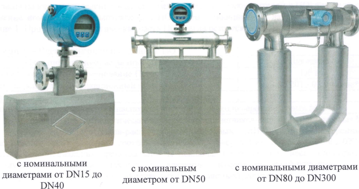
Рисунок 1– Общий вид счетчиков-расходомеров массовых МИР с раздельным и компактным монтажом

Схема пломбировки от несанкционированного доступа представлена на рисунке 2. Пломбировка осуществляется изготовителем нанесением наклеек из легко разрушаемого материала на вторичный преобразователь.