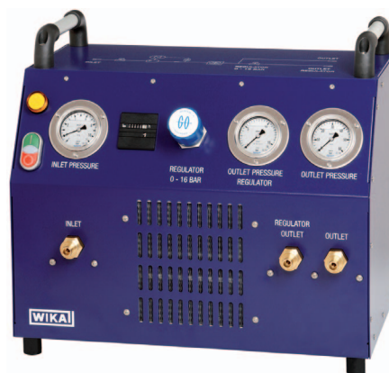
Портативный компрессорный модуль SF 6 тип GTU-10