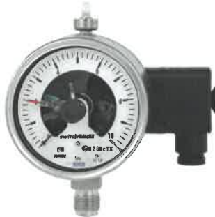
Модификации PGS23, PGS26