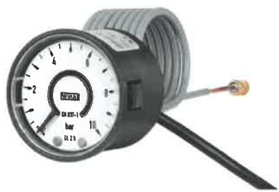
Модификации PGS05, PGT02