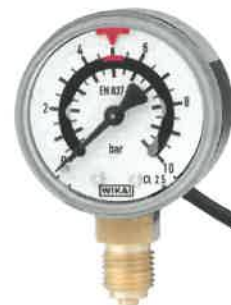
Модификации PGS10, PGS11