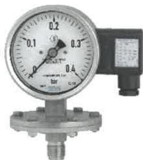
Модификации PGT43, PGT43HP