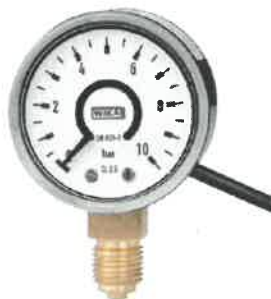
Модификации PGS06, PGS07, PGS25, PGT10, PGT11, PGT21