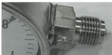
Рисунок 5 - Пример пломбирования манометров продеванием контровочной проволоки и навешивания свинцовой или пластиковой пломбы.

Место нанесения знака поверки манометров представлено на рисунке 7.