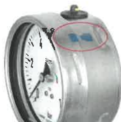
Рисунок 6 - Пример пломбирования манометров нанесением на кольцо и боковую поверхность корпуса специальной наклейки