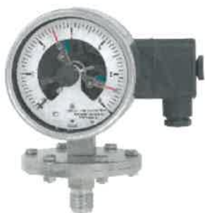
Модификации PGS43, PGS43HP