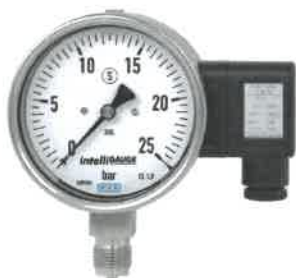
Модификации PGT23, PGT26