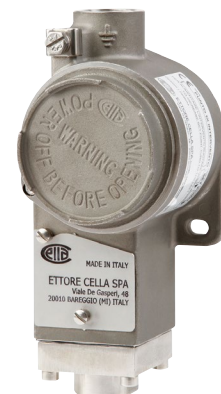
Рис. слева: переключатель с корпусом из алюминиевого сплава

Рис. справа: переключатель с корпусом из нержавеющей стали